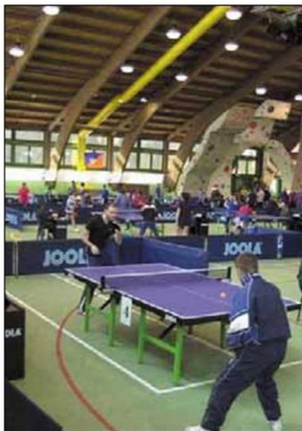
TENNIS DA TAVOLO Campionati a squadre