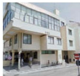
IL COMUNE DI SAN NICOLA

vo San Nicola CE, società che opera con successo sul territorio da oltre quarant'anni, investendo notevoli energie proprio nel settore giovanile. In tal senso, si colloca inoltre l'accordo di questi giorni della società pongistica locale con gli Istituti scolastici di 1° e 2° per la promozione e lo sviluppo di quest'avvincente disciplina nelle scuole. NDP