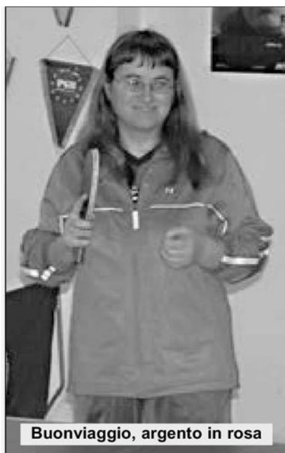
Buonviaggio, argento in rosa

L'atleta del Tennistavolo Campobasso, peraltro, ha preso il via anche nel singolo femminile top 199/440, giungendo nella circostanza in settima posizione.