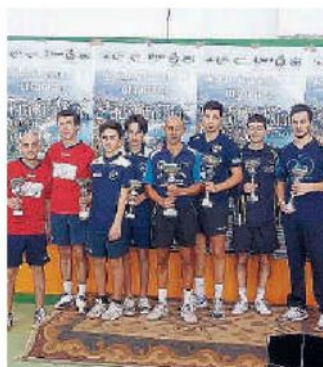
Le nuove promesse. Nelle gare in molti si sono messi in luce