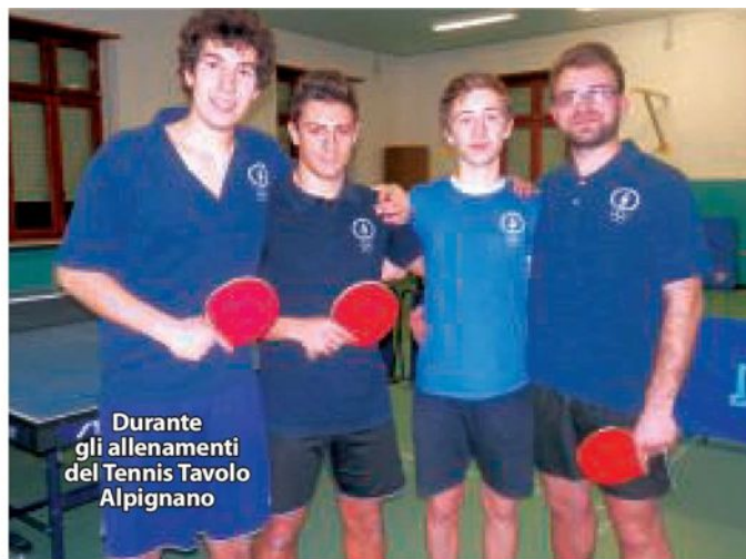
Durante gli allenamenti del Tennis Tavolo Alpignano