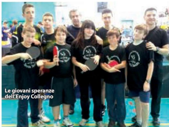
Le giovani speranze dell'Enjoy Collegno