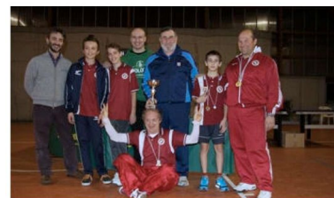
Alcuni atleti dell'US Villa Romanò.