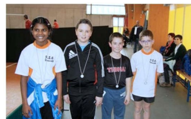
I primi quattro classificati della categoria Giovanissimi