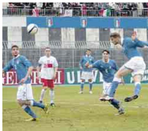
Il 16 maggio c'è l'atteso passaggio della Mille Miglia. Le vetture che hanno fatto la storia mondiale dell'auto. Sopra, una fase di gioco della partita che la nazionale Under 20 ha disputato allo stadio Del Duca