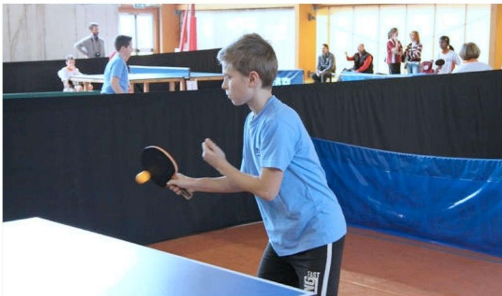
Atleta durante la gara di Monguzzo