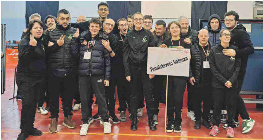
INCLUSIONE Tt Valenza rappresenta, da tempo, un prezioso riferimento per tutto l'Alessandrino