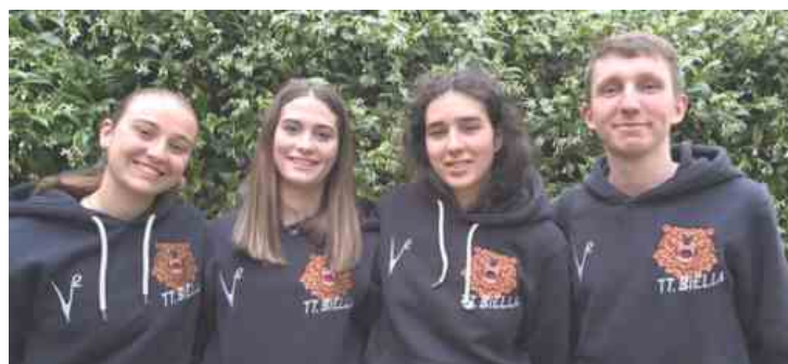
TT Biella V2, play-off amari in B femminile: sfuma la promozione in A2

Annunci lavoro Animalerie A tavola con gusto Benessere e Salute Biella motori Casa Edilizia Consulta il meteo