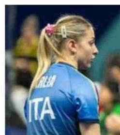
Arlia in maglia azzurra

nile di Dragoman e Szocs ha capitato in semifinale contro le campionesse cinesi. D.C.