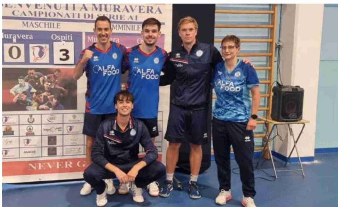
La gioia L'Alfa Food Bagnolese festeggia dopo la vittoria ottenuta in casa del Muravera

La gara di ritorno giovedì a Bagnolo. Vincendo sarà sfida per il titolo con Sassari o Messina