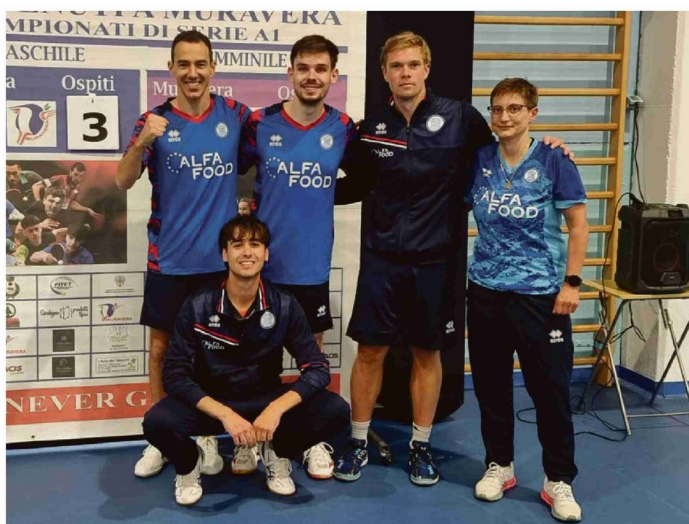
L'Alfa Food Bagnolese festeggia la vittoria a Muravera