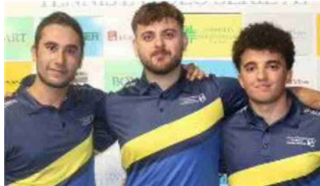
La squadra dell'Apuania Carrara che ha terminato al 2° posto in Serie B1