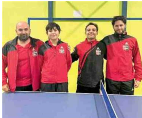
L'ultimo acuto La Cobi Meccanica vince in Serie B2