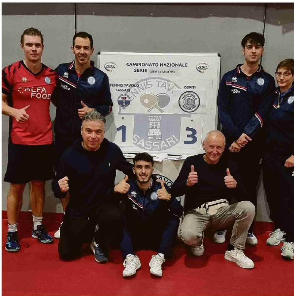
Giocatori, coach e dirigenti dell'Alfa Food Bagnolese

Messina 25, Muravera 21, Marcozzi 18, Apuania Carrara 17, Virtus Servigliano 16, Santa Tecla Nulvi 7.