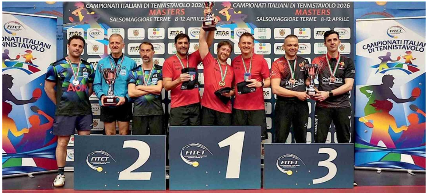
La premiazione della squadra Master verzuolese grande protagonista nei playoff tricolori

Si chiudono nel weekend i campionati a squadre nazionali e regionali e per la società verzuolese sarà giorno di festa alla palestra di via XXV aprile. Nella B1 maschile, l'A4 Tonoli, già promossa, sabato alle 16 riceverà Mondovì. In campo anche la B2 maschile della A4 Scotta, che festeggia la matematica promozione contro Collegno. Match importante per la A4 Avis capolista della C1, impegnata in casa contro Torino. Nel weekend, spazio ai campionati di C2, Prima, Seconda e Terza divisione e al Grand prix interregionale giovanile, con tanti atleti del vivaio verzuolese nell'ultima prova a Novara. —