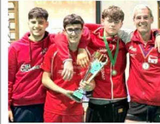
I diavoli rossi con la coppa di società