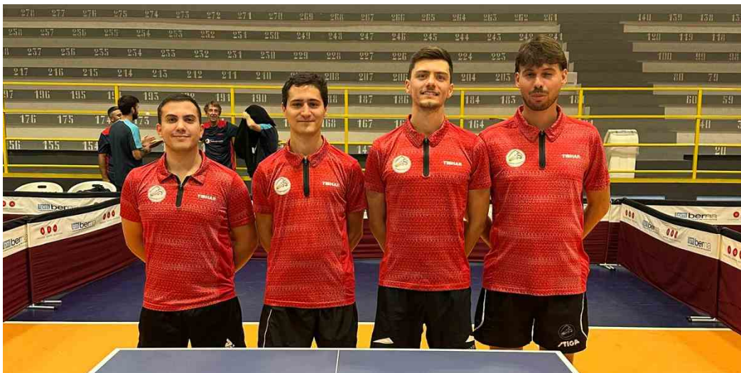
La formazione di C1 del Gruppo Giovanile San Michele di Ripalta Cremasca

L'Asd Gruppo Giovanile San Michele ottiene la promozione in B2, battendo Gallarate e coronando una stagione straordinaria per Ripalta Cremasca