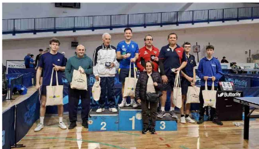
IL RICORDO DEL GS REGALDI Un momento delle premiazioni al Pala Sartorio