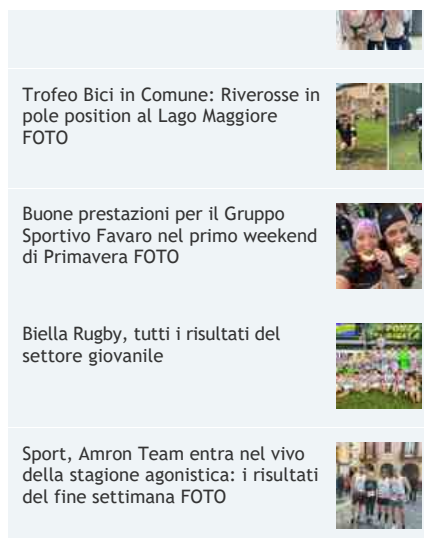
Trofeo Bici in Comune: Riverosse in pole position al Lago Maggiore FOTO

Le competizioni hanno preso il via sabato con le gare di doppio.