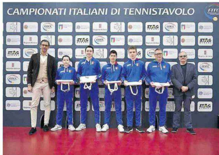
La nazionale Under 15 premiata al Pala De Santis

AL PALA DE SANTIS UN PREMIO SPECIALE PER LA NAZIONALE CHE HA CONQUISTATO UN ARGENTO AI MONDIALI IN ROMANIA