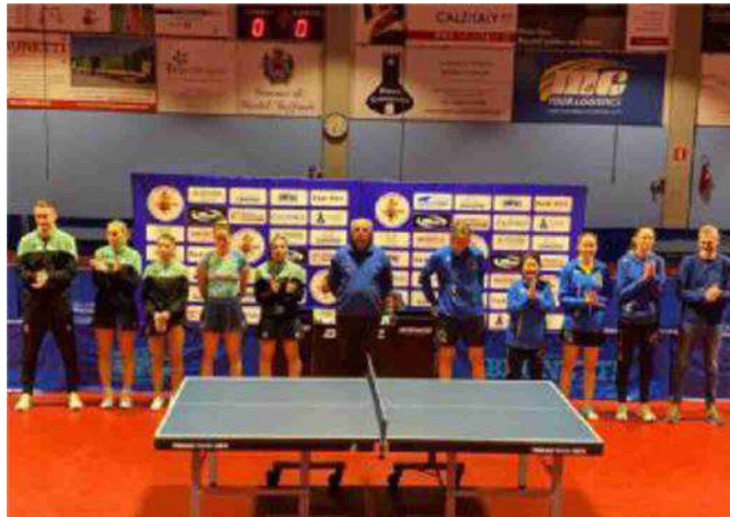
Le squadre schierate prima del match di ieri

le castellane il 6 aprile contro Sassari, terza forza del girone (18.30). Una sfida che, senza alcun significato di classifica, sarà un utile warm up in vista dei playoff. D.C.