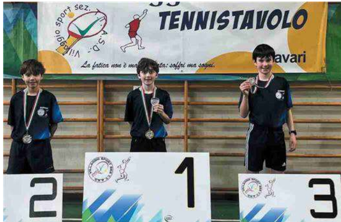
Il podio Under 11