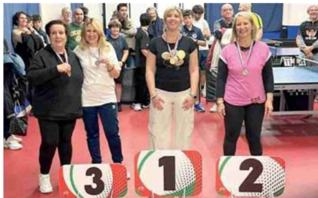
Le vincitrici del torneo nella sezione femminile

Tante donne ma anche giovannissimi con un buon livello tecnico