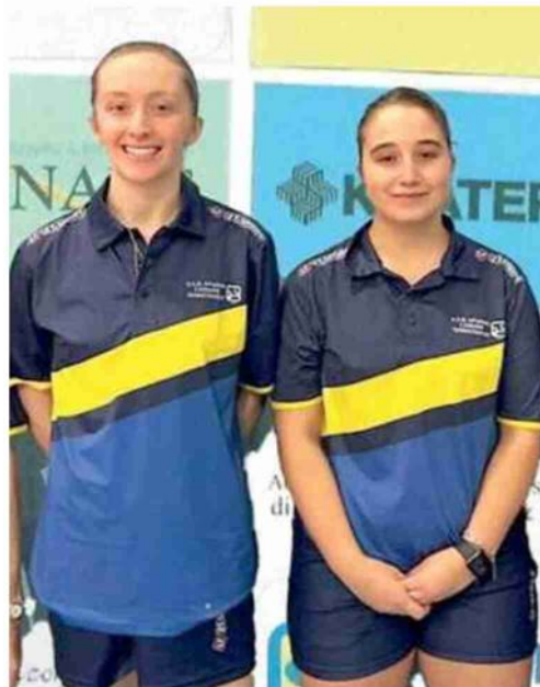
Le ragazze dell'Apuania

Le apuane del girone A toscano con 8 vittorie su 8 partite