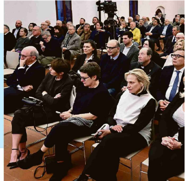
L'iniziativa ha combinato momenti di talk, testimonianze e premiazioni