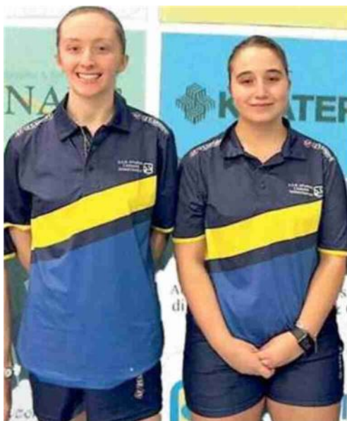
Le ragazze dell'Apuania

Le apuane del girone A toscano con 8 vittorie su 8 partite