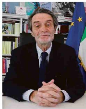
Il presidente di Lombardia collegato in video