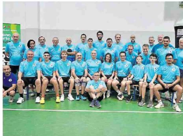
IL BILANCIO La squadra del Tennistavolo Rovigo al completo

INIZIA LA FASE DECISIVA DELLA STAGIONE PER CHI AFFRONTA I PLAYOUT SALVEZZA E CHI I PLAYOFF PER LA PROMOZIONE