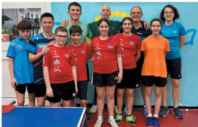
I partecipanti allo stage giovanile di FiTeT Liguria