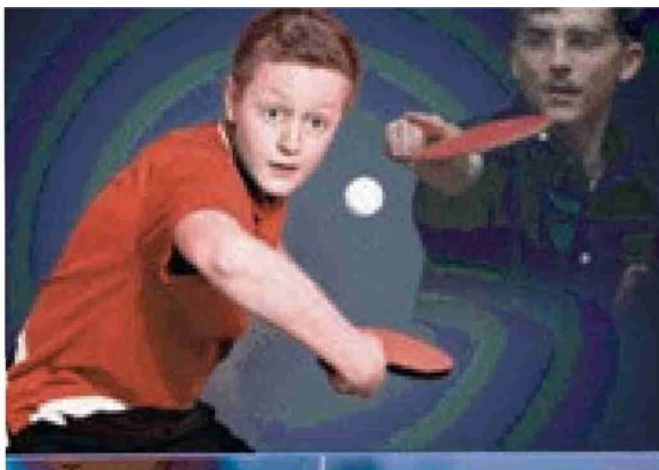
Organizzato dall'Asd Tennistavolo L. Siani

La Federazione Italiana Tennistavolo (FITET) organizza il Circuito delle attività Promozionali e Amatoriali di Tennis Tavolo denominato "TTEC-FITET" (acronimo di Table Tennis Exclusive Community - Federazione Italiana Tennistavolo) per il quale si applicano le norme dei regolamenti generali della FITET. L'attività sportiva oggetto del Circuito TTEC-FITET ha una duplice natura: promozionale, con il solo scopo di far conoscere e apprezzare la pratica del Tennis Tavolo attraverso il confronto competitivo nonché d'incentivare la formazione sportiva con l'obiettivo di aumentare il numero degli aderenti e dei praticanti il tennistavolo; amatoriale, con il solo scopo di coinvolgere le persone ad iniziare a giocare a tennistavolo con modalità esclusivamente ludico-motorio e ricreative. Il Circuito TTEC-FITET è realizzato a tappe ed eventi che si svolgono tra il 1° luglio e il 30 giugno di ciascun anno (stagione sportiva).