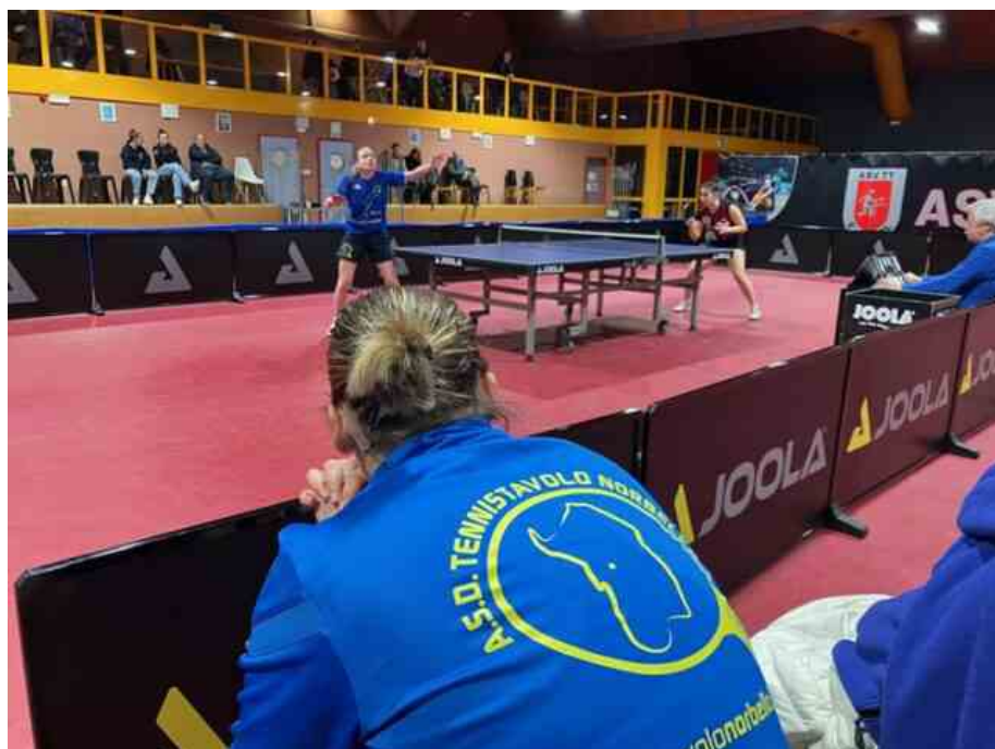
Durante la gara a Bolzano del Norbello

FITET Sardegna: le più recenti notizie dal tennistavolo sardo.