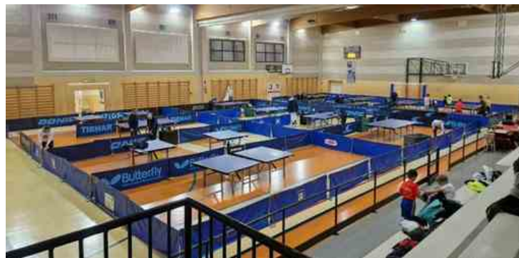
TT Biella: nel fine settimana il Torneo Over di tennistavolo "Memorial Marco Ruffanello"

Sarà un fine settimana all'insegna del tennistavolo quello in programma a Biella. Sabato 14 e domenica 15 marzo, dalle 8 alle 19, la palestra dell'ITI Quintino Sella di via Ivrea 1 ospiterà il Torneo Over di Tennistavolo "Memorial Marco Ruffanello", manifestazione organizzata e gestita dalla ASD Tennistavolo Biella.