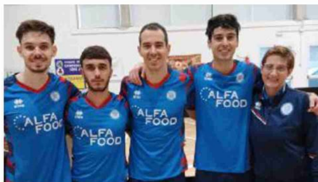
I sorrisi La squadra dell'Alfa Food Bagnolese