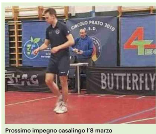
Prossimo impegno casalingo l'8 marzo