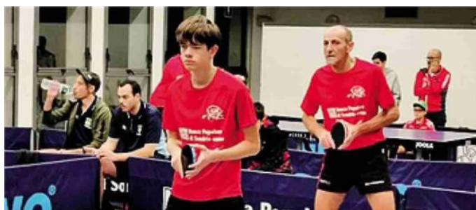
Gs Csi Morbegno, affiatamento tra giovani e veterani