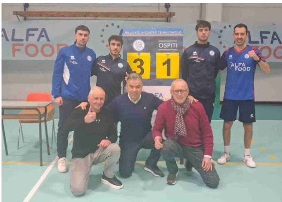
L'Alfa Food prosegue la sua marcia trionfale. Anche ieri vittoria importante per la corsa al primo posto

Next stop Domenica prossima l'Alfa Food farà visita al Messina quarta forza del campionato