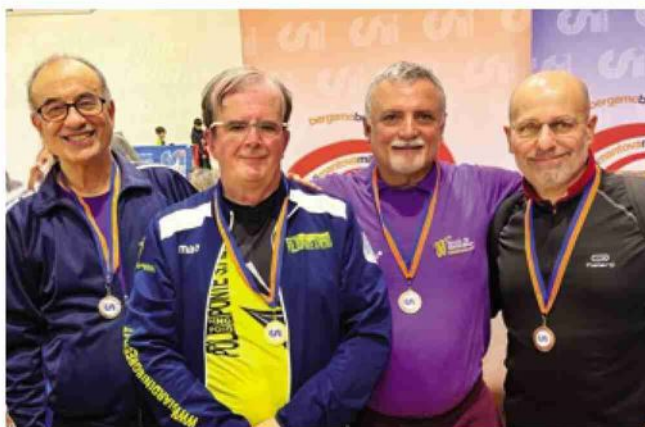
Tennis tavolo. Podio regionale Veterani B