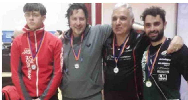
Tennis tavolo. Podio regionale Eccellenza B