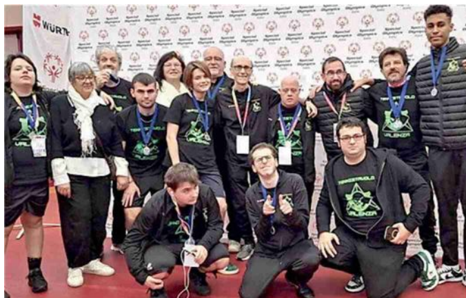
Il gruppo degli atleti e dei dirigenti a Senigallia

porto che si è creato tra di loro: a livello sportivo tanti allori sono stati una sorpresa piacevole e sono contento per i nostri giocatori». F.G. —