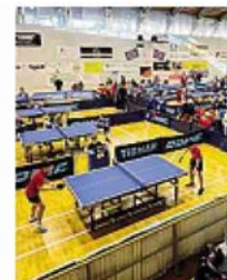
Un momento del campionato