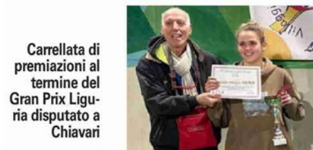
Carrellata di premiazioni al termine del Gran Prix Liguria disputato a Chiavari