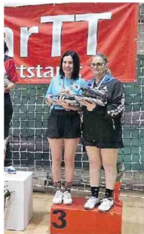
PARIMERITO Spinello è terza