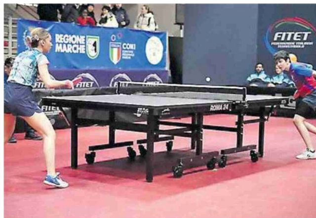
Una delle semifinali della Coppa Italia di tennistavolo