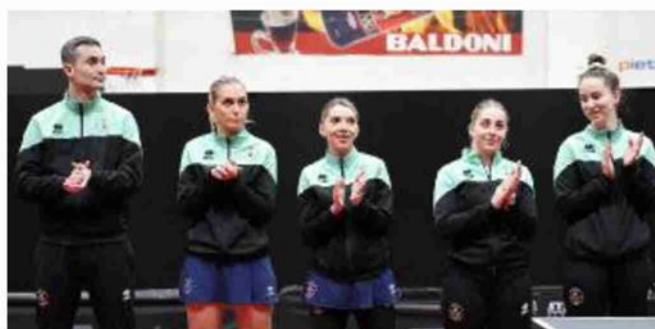
Le finaliste La Brunetti Castel Goffredo ieri ad Ancona

La Bagnolese illude con il doppio ma poi cede alla reazione della Top Spin Messina Terzo posto in palio con Muravera