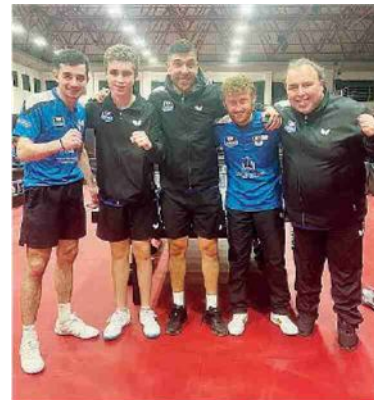
In finale La Top Spin esulta ad Ancona