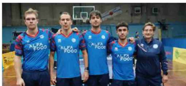
Per il bronzo I ragazzi dell'Alfa Food Bagnolese