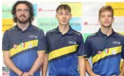
La squadra di Serie B2 dell'Apuania Tennistavolo, impegnata a mantenere la testa della classifica