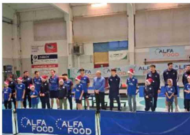
L'Alfa Food alza bandiera bianca contro il Muravera

il primo set (11-8) ma poi s'impone con una certa scioltezza nei tre successivi (7-11, 8-11, 7-11). Nonostante la sconfitta l'Alfa Food conserva comunque la vetta. Sassari infatti, battendo 3-1 Messina, si porta a quota 17 come i mantovani, che però hanno a favore lo scontro diretto. Ora le final four di Coppa Italia che si terranno ad Ancona il 3 e 4 gennaio: avversario in semifinale, sarà la quarta forza del campionato: il Top Spin Messina. D.C.