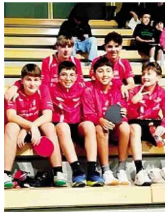
I giovani pongisti del Morbegno

Nel breve periodo, invece, i diavoli rossi saranno impegnati il 7 e 8 dicembre nel Campionato regionale Csi di tennistavolo a Villa Romanò (Co), cui faranno seguito le tappe di Villa Guardia (11 gennaio 2026), Veduggio (8 febbraio) e Sarnico (29 marzo). P.Val.