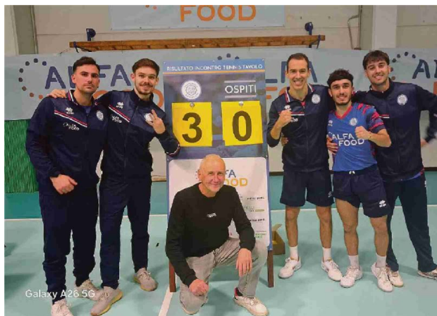
L'Alfa Food Bagnolese festeggia la vittoria contro il Messina

In classifica comanda Sassari con 12 punti, davanti alla Bagnolese 11, Top Spin Messina 8, Muravera 6, Virtus Servigliano 3, Apuania Carrara e Marcozzi Cagliari 2 e Santa Tecla Nulvi 1. Virtus Servigliano e Marcozzi hanno una gara in meno..