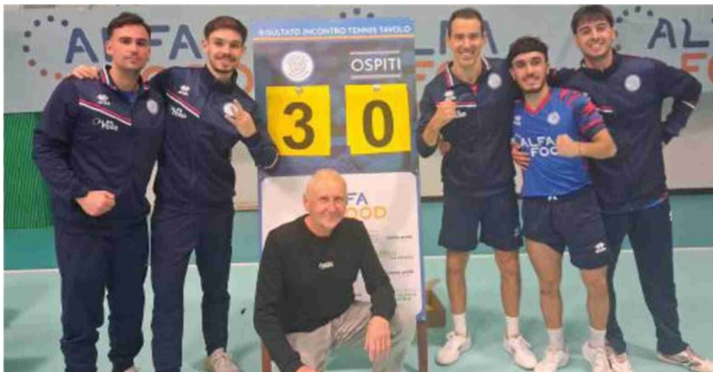
Soddisfazione La gioia dell'Alfa Food Bagnolese dopo la vittoria di ieri

Dopo questa ottima prova il team di coach Semenza si candida a contendere seriamente a Sassari il primato