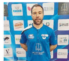
Manhani jr Battuto alla "bella"

Sassari 12; Bagnolese 11; Top Spin 8; Muravera 6; Virtus Servigliano 3; Apuania Carrara, Marcozzi 2; Santa Tecla Nulvi 1.