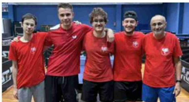
Applausi Il quintetto del San Marco capolista in serie D2

Dura sconfitta invece per il San Marco BM in serie D3 nel derby contro il TT San Pancrazio. S. Cam.