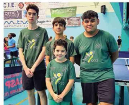
Gli atleti dello Splendor 1922