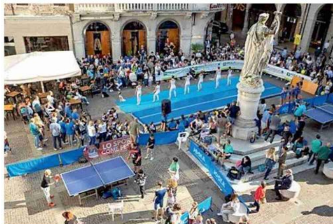
Ping pong in piazza a Treviso per l'anniversario del Csi

bile all'oratorio di Visnadello. L'ambizioso progetto di iscrivere le squadre ai campionati Csi e alla federazione Paralimpica sta per diventare una realtà. —