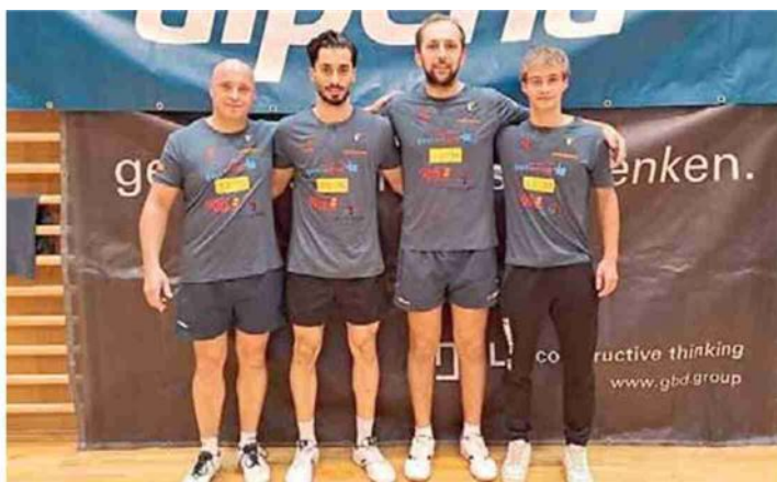
La formazione dello Sport Club Sarentino