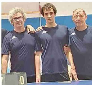
Il team del Gstt Bordighera