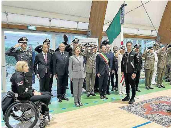
JESOLO La cerimonia di ieri alla presenza delle autorità e degli atleti e campioni paralimpici dell'esercito italiano

PRESENTI ALL'EVENTO LA SENATRICE ISABELLA RAUTI, PREFETTO E QUESTORE. GIORNATA TRA STAND E DIMOSTRAZIONI