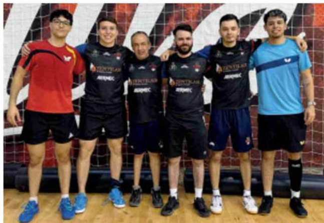
La formazione del Santa Tecla impegnata oggi in Champions