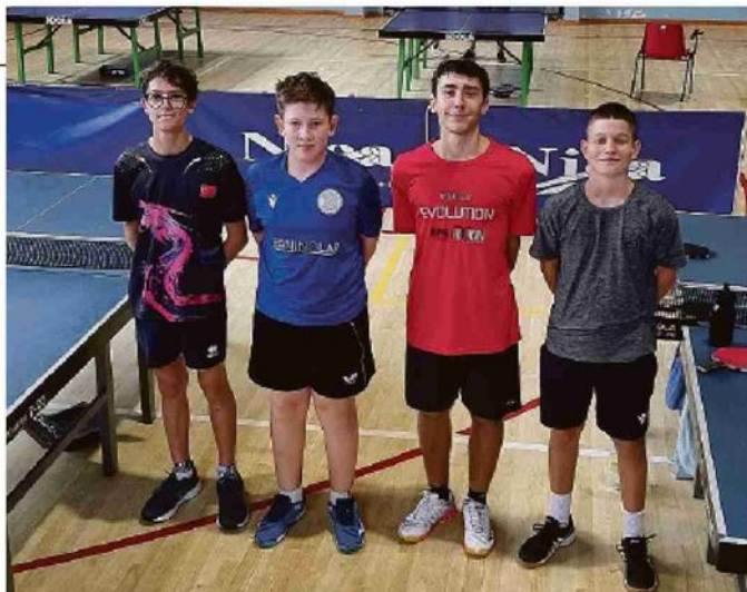
I giovani dell'Alfa Food al TT Valcamonica

open day gratuiti per i ragazzi dai 7 agli 11 anni: martedì 2, 9 e 16, dalle ore 16.45 alle 18.30. Chi è interessato può recarsi alla palestra delle Scuole Medie in via Matteotti per provare a giocare. I corsi sono seguiti da tecnici federali.