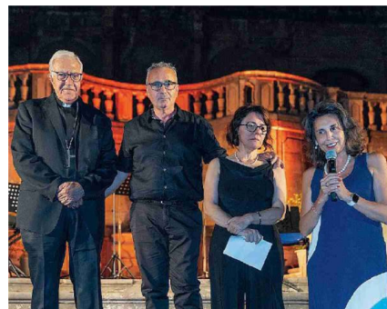
Per Sara I genitori della studentessa, la rettrice e l'arcivescovo