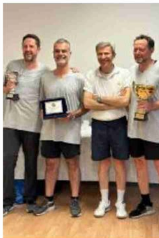
Il presidente e il team Rotary