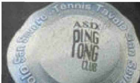
Nel girone D2a