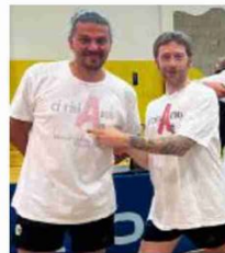
Euforia in casa TT Vicenza

Sgonico 24, Tt Sarneola, Rangers Udine e Tt Reggio Emilia 14, S. Polo Parma e Villa d'Oro Modena** 10, TTVICENZA B** 0. An.Si.