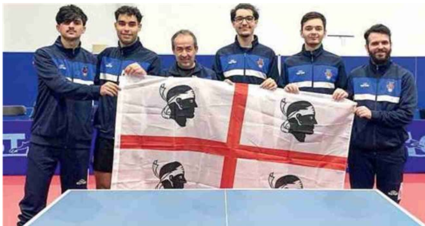
La squadra di tennis tavolo Santa Tecla di Nulvi

la squadra di Nulvi ha preso parte alla Grand Final