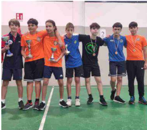
Alcuni degli atleti premiati. A destra, i volontari

sarà la palestra di via Molise, casa della Polisportiva San Giorgio Limito. La terza tappa resterà, ancora una volta, sul territorio: è in programma il 4 maggio in corso Europa a Casano d'Adda. Lì si allena e gioca l'Ascatt, la locale società di tennistavolo. A chiudere l'edizione 2025 di Prime racchette sarà la quarta tappa presso la palestra di via Mecenate, organizzata dal Centro sportivo Bonacossa.