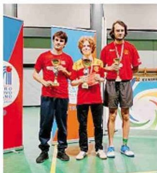
Il podio della categoria Open A

La classifica per società ha premiato Valmadrera (448 punti), davanti a Morbegno (340) e Abbadia (279). M.Mas.