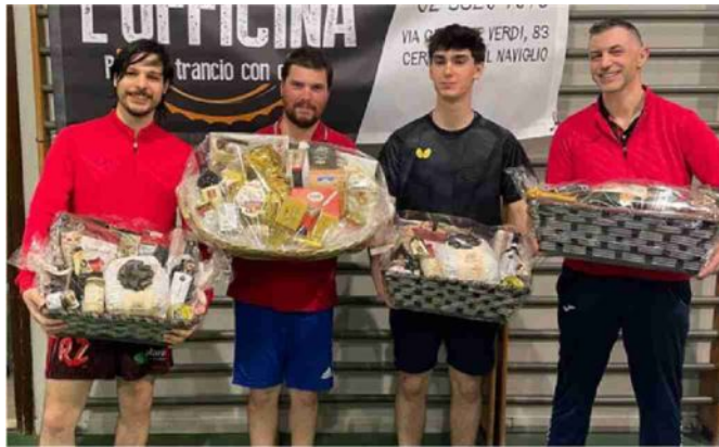
Alcuni degli atleti premiati nella quarta tappa del Circuito provinciale a Cernusco

Apprezzamenti e complimenti sono arrivati da tutte le società presenti per l'ottima organizzazione, la simpatia con la quale sono stati accolti e l'ambiente cordiale e rispettoso.