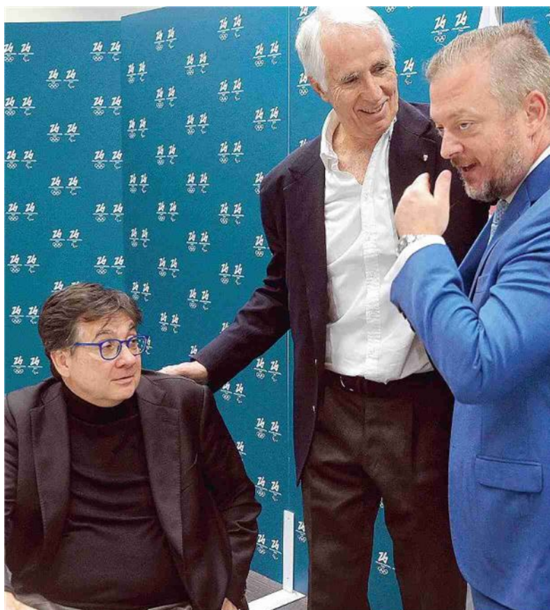
Da sinistra Luca Pancalli, Giovanni Malagò e Andrew Parsons alla cerimonia a un anno dall'apertura delle Paralimpiadi invernali 2026

Milano-Cortina, gli organizzatori: il mondo delle disabilità avrà attenzione, vogliamo creare una nuova percezione