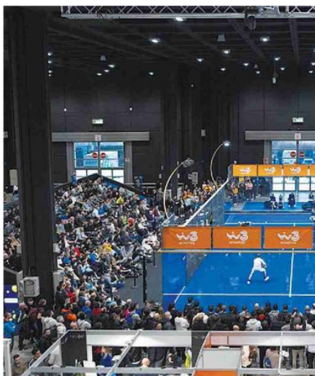
Foto della passata edizione dedicata al padel