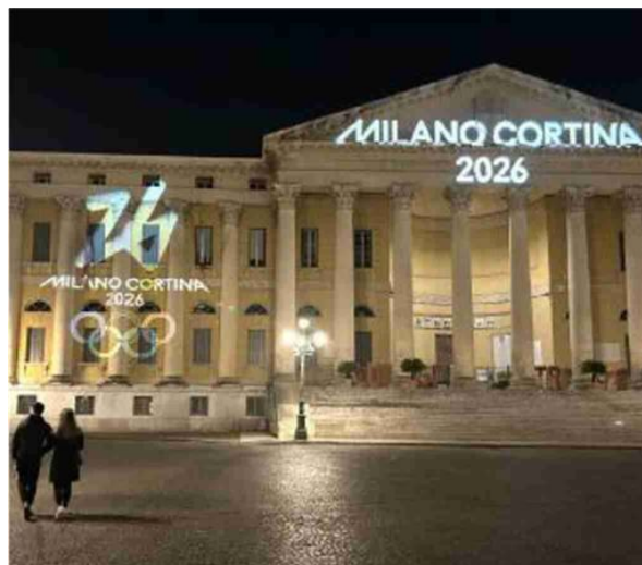
Il logo Su Palazzo Barbieri il logo di Milano-Cortina 2026

tà di acquistare i biglietti per le gare e le cerimonie, fino a esaurimento scorte. Giovedì esattamente a un anno dalla cerimonia di apertura, prenderà il via la vendita libera dei biglietti per i Giochi. I prezzi partiranno da 10 euro per gli Under 14. Oltre 200mila biglietti saranno disponibili a meno di 35 euro.