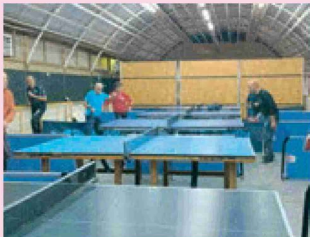
... presso la sede dell'Asd Luigi Siani