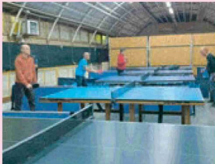
Un momento dell'attività...