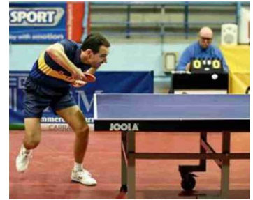
Un giocatore dell'Apuania Carrara durante una partita ufficiale

festazione importante che noi abbiamo sempre onorato al meglio, le squadre presenti sono tutte molto ben attrezzate e competitive e noi cercheremo di dare il meglio».