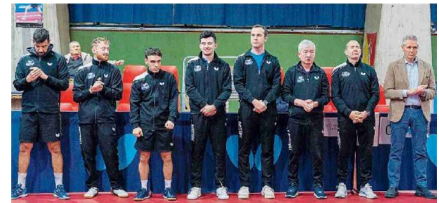
Prova d'orgoglio La Top Spin Messina ha lottato alla pari con l'Apuania Carrara

a 0), era Mutti a vincere 14-12. Seguiva l'11 a 5 per Mutti . Nel quarto parziale Stoyanov sventava un match-point, siglando poi il 12-10 che rimandava il verdetto alla "bella". Nel mini quinto set Mutti prevaleva per 6 a 1 facendo scattare la festa fra i padroni di casa.