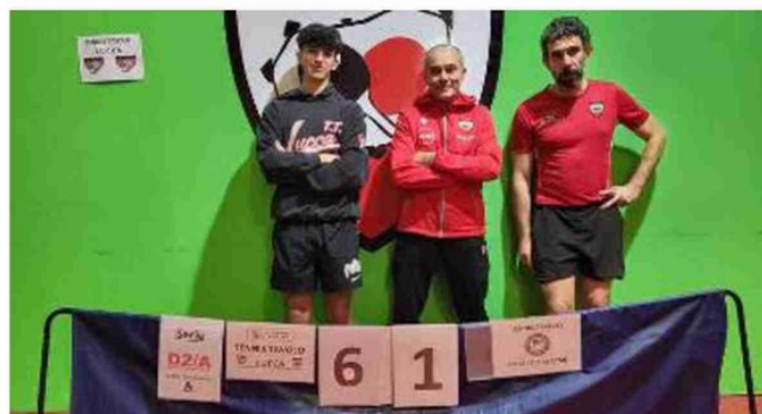
Nelle foto: in alto, la formazione del Tennistavolo Lucca del girone «A» di serie «C» femminile; qui sopra: il team che milita nel girone «A» di serie «D2» maschile