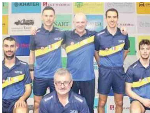
La formazione dell'Apuania Carrara capolista nella A-1