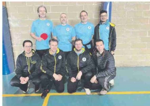
TENNISTAVOLO ROVIGO Il gruppo di otto atleti che ha gareggiato al torneo del Cinque Cerchi, società amica di Cartura