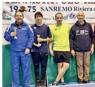
Il Gstt Bordighera