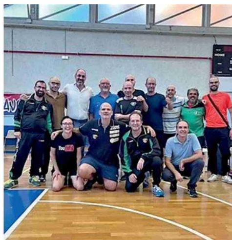
Il gruppo del Tennistavolo Valenza

I valenzani, impegnati sabato in campionato e domenica in Coppa Italia, hanno inoltre accolto diversi atleti di Tortona. «Erano rimasti in pochi e non riuscivano a sostenere le spese. Ci siamo venuti incontro – prosegue -. Giocano sotto il nome di Valenza, per la sezione di Tortona». Per chi fosse interessato a mettersi in contatto con le società, i riferimenti sono sulle pagine Facebook dei club. L.L.O. —