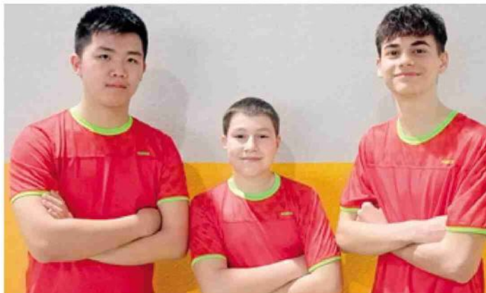
TT Biella Barbera Auto serie D3

CLASSIFICA: TT Splendor 1922 Immobiliare Bugella 18 (9), TT Ivrea 14 (9), TT Aosta 12 (9), Polisportiva FC Vigliano 11 (10), TT Biella Barbera Auto 7 (9), TT Sisport A 3 (10), TT Sisport D 1 (10).