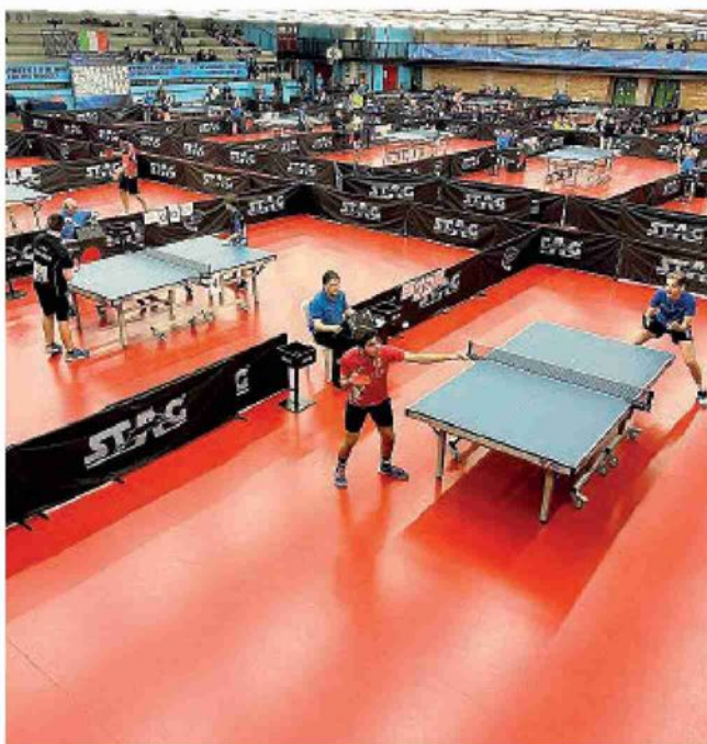
Palatennistavolo De Santis. La tre giorni nell'impianto di Campitello

Nel pomeriggio, dalle 14, saranno in campo i criterium di qualificazione Under 19 femminile e Under 19 e Under 21 maschili, che ammetteranno 12 ragazze e 16 ragazzi di entrambi i settori ai singolari di domenica, che cominceranno alle 8,30 e assegneranno i podi tricolori. Sempre domenica i partecipanti alle prove di Criterium che non si siano qualificati potranno partecipare a un torneo di consolazione.