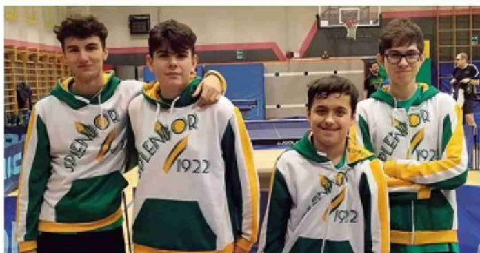
Splendor Immobiliare Bugella serie D3