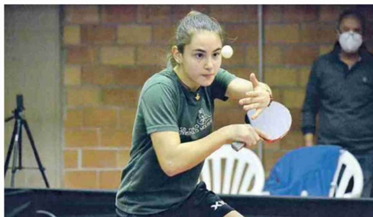
Una giovane atleta in azione

SONO IN PROGRAMMA QUESTO FINE SETTIMANA I CAMPIONATI ITALIANI GIOVANILI UNDER 19 E UNDER 21 DECINE SOCIETÀ PRESENTI