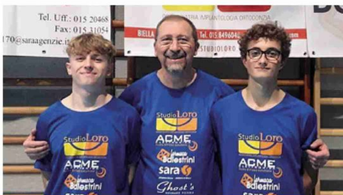
FC Vigliano Studio Dentistico Loro serie D1