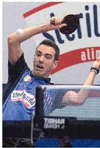
Bobocica ai tempi Sterilgarda

Olimpiadi: Pechino 2008 e Londra 2012. In bacheca ha 7 titoli nazionali a squadre (tra cui quello con la Sterilgarda Castel Goffredo nel 2009/10) e 6 titoli nazionali individuali. Atleta dell'Aeronautica militare, è attualmente in forze all'Apuania Carrara.