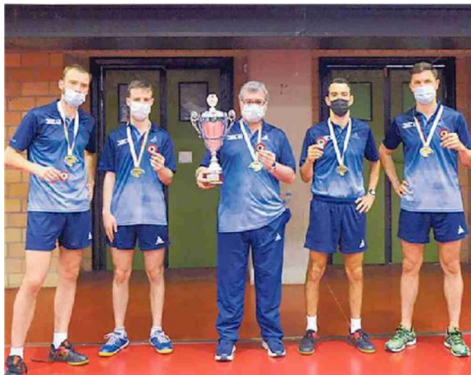
La premiazione della coppa Italia del 2021

ti - come abbiamo sempre fatto, la manifestazione della Coppa Italia, giocare a Napoli è stata una buona scelta della federazione; la nostra squadra sarà in campo con una formazione competitiva, ma anche gli altri team sono ben attrezzati».