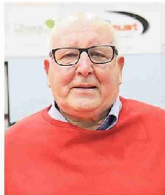
Sciannimanico, dg castellano