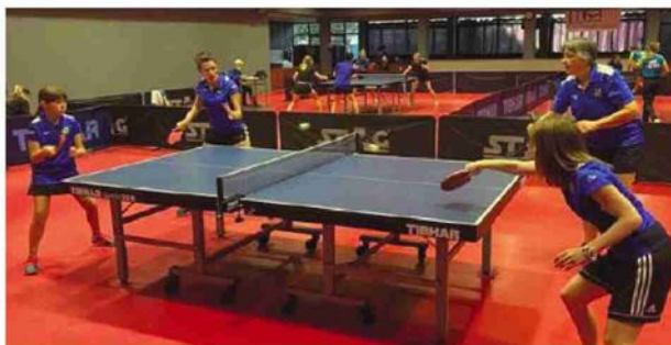
La squadra di serie B dell'Asca durante una fase di riscaldamento